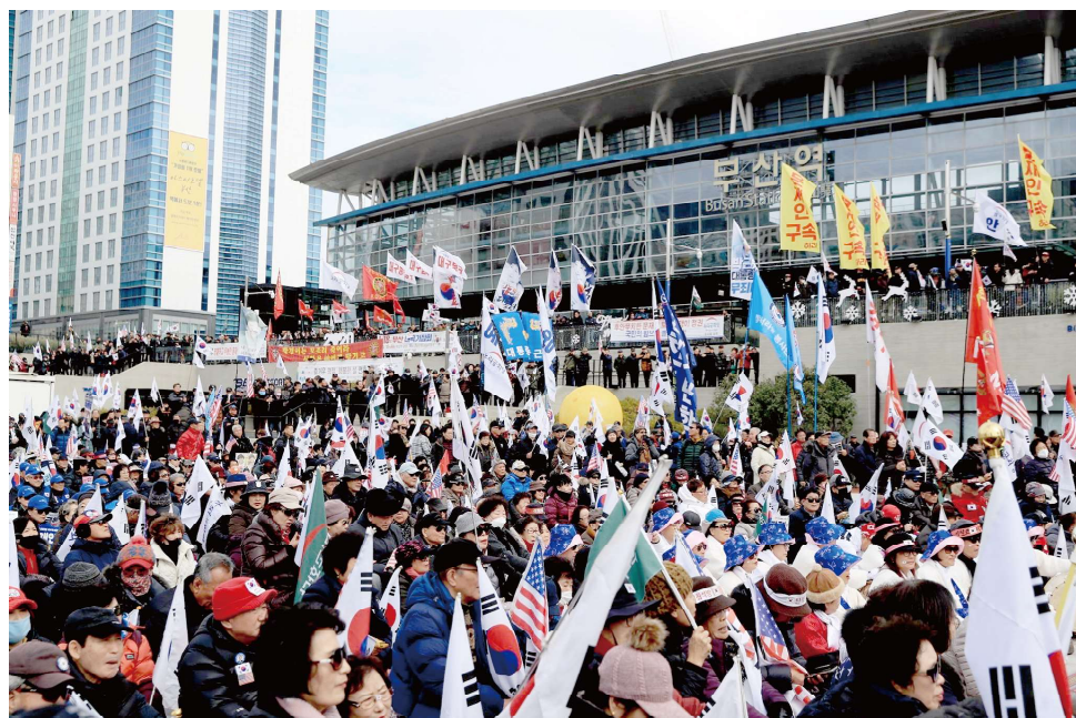
▲ 2020년 1월 18일(토) 부산역 광장에서 천만인무죄석방본부 주최 · 우리공화당 주관 제167차 태극기집회가 열렸다. 하나의 태극기집회를 천명한 태극기집회답게 부산지역 시민들과 당원들, 전국 각지에서 함께 하고자 모인 당원들의 참여로 부산역 광장을 가득 메운 단합된 힘을 보여주는 자리였다.

18일 부산역에서 열린 태극기집회 중, 우리공화당은 “문재인 좌파독재정권은 2018년 6·13 지방선거 직전인 6·12 미북 정상회담(싱가포르 회담)을 중재함으로써 그것을 이용하여 지방정권 전체를 문재인 좌파세력이 장악했다”고 지적했습니다.